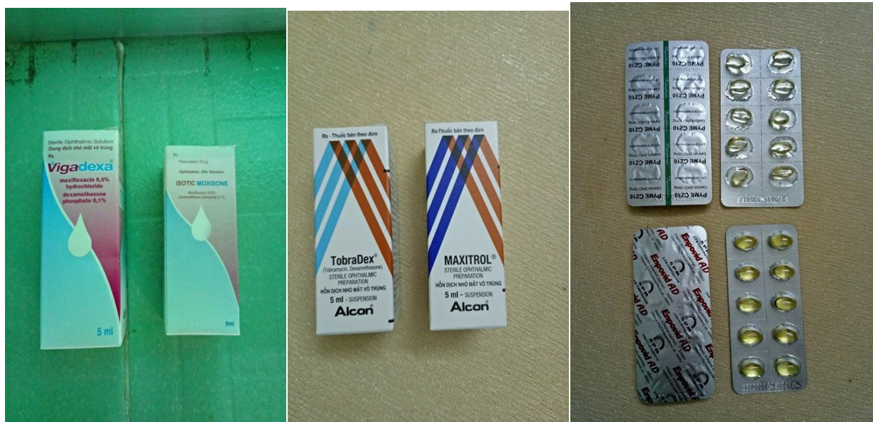
Hình 1.1 Một số thuốc nhìn gần giống nhau