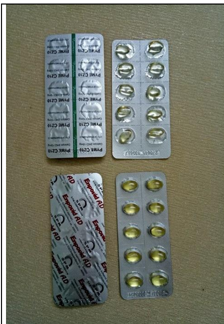
Pyme CZ10 và Enpovid AD